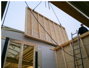
Abb. 2