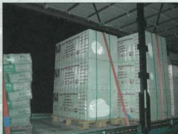
Sicherung mit einem Zurrurt niedergezurt