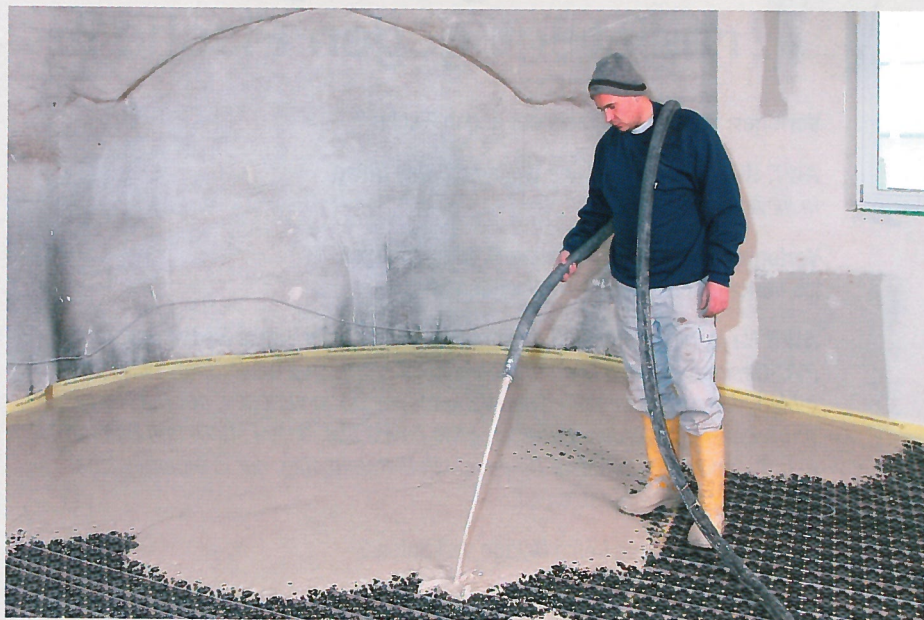
Die Heizschlangen der Fußbodenheizung sind verlegt, der Fließestrich wird eingebaut, später folgt das Funktions- und das Belegreifheizen.

Die maximal zulässige Temperatur wird bei gleichzeitiger guter Lüftung solange gehalten, bis der Estrich ausreichend trocken ist. Man sagt dann, der Estrich ist belegreif. Das ist bei einem Calciumsulfatestrich mit einer Restfeuchte von \leq 0,3\% und bei einem Zementestrich mit \leq 1,8\% erreicht. Das Belegreifheizen ist erforderlich, damit eine zu hohe Feuchtigkeit den später aufgeklebten Belag nicht beschädigt (z.B. Blasen-